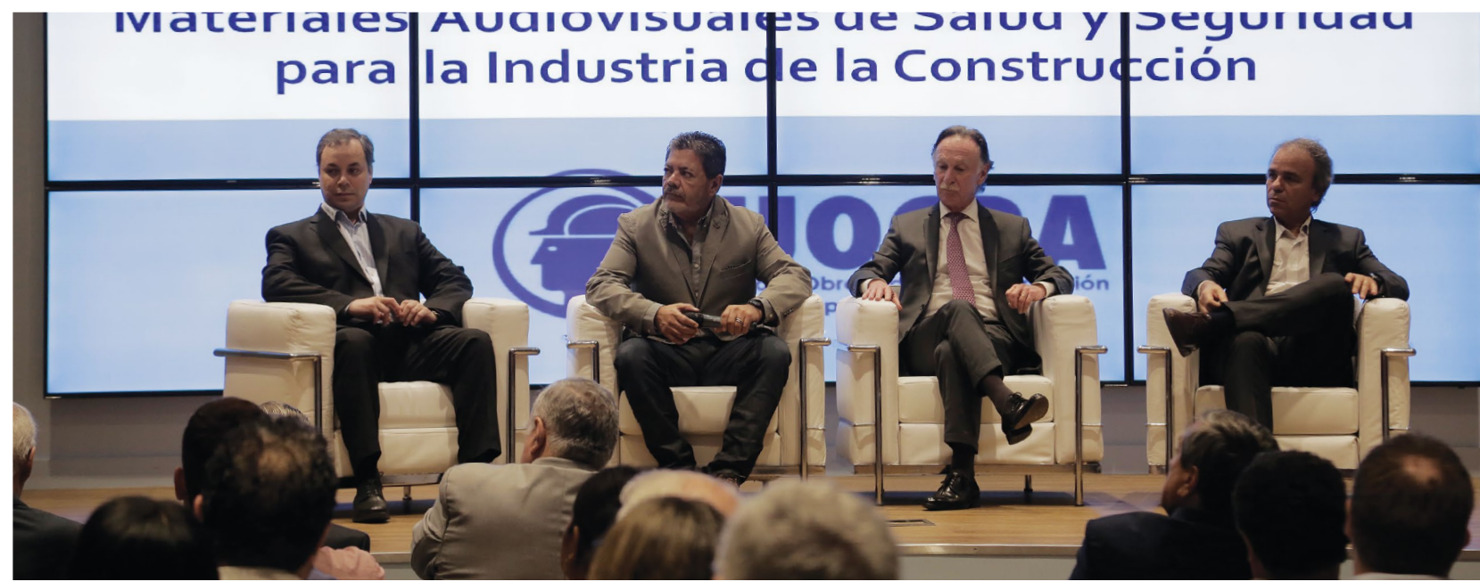
El panel de expositores en la apertura de la Jornada de Salud y Seguridad Laboral.